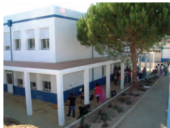
Escola EB1 e jardim de Infancia de Mora