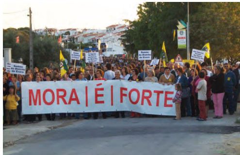
Manifestação contra a integração do Concelho de Mora no Distrito de Portalegre