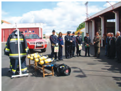
Oferta de equipamento aos Bombeiros V. de Mora