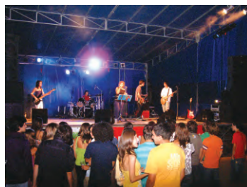
Espectáculo ExpoMora 2009