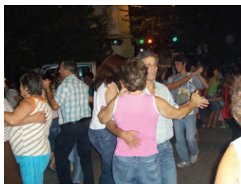
Animação de Verão