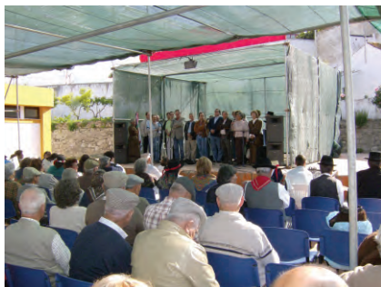
Comemorações do Mês do Idoso