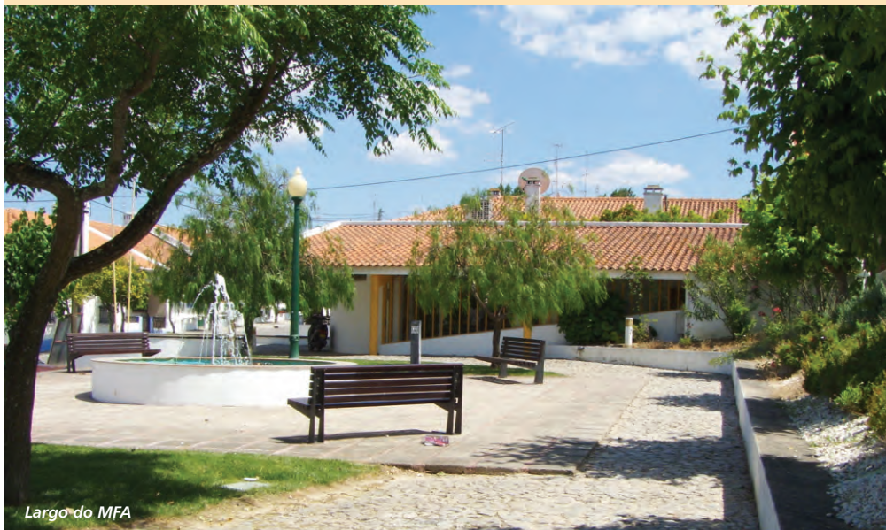
Largo do MFA

Estamos convictos que, no próximo dia 11 de Outubro, a população da freguesia de Mora estará connosco e escolherá os melhores para a sua terra, os candidatos da CDU.