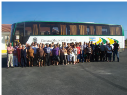
Excursão de Reformados