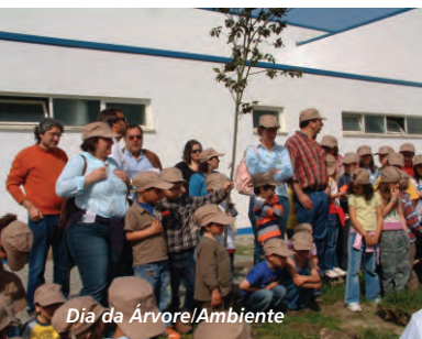
Dia da Árvore/Ambiente