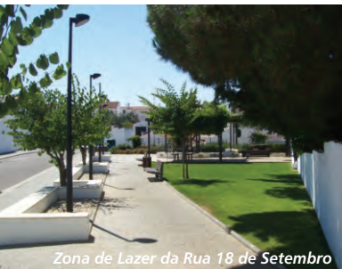
Zona de Lazer da Rua 18 de Setembro