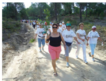
Programa «Envelhecimento Activo»