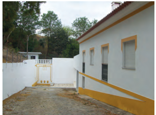
Talude do Largo do Calvário/Fonte das 3 bicas