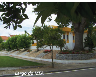
Largo do MEA