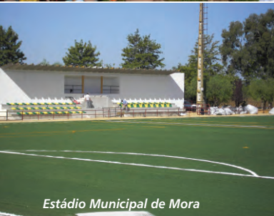
Estádio Municipal de Mora