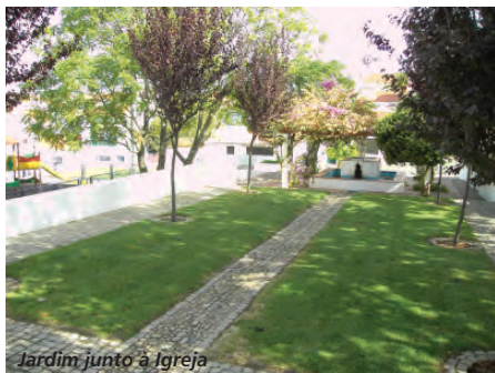
Jardim junto à Igreja