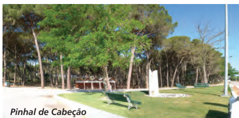
Pinhal de Cabeção