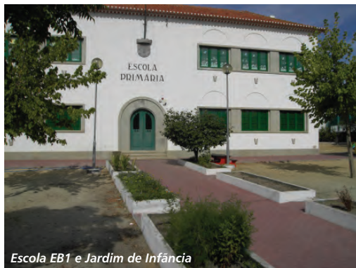
Escola EB1 e Jardim de Infância