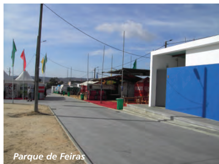
Parque de Feiras