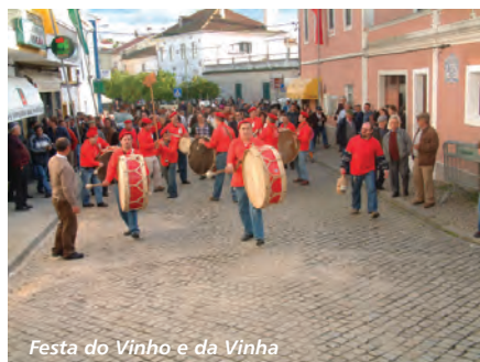
Festa do Vinho e da Vinha