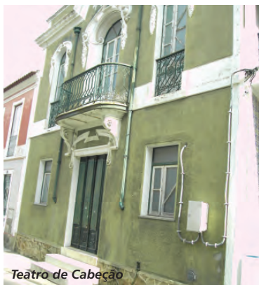
Teatro de Cabeção