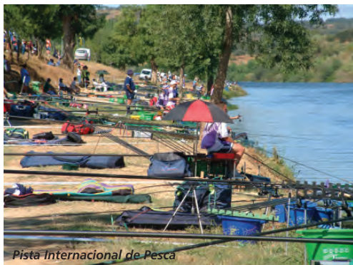
Pista Internacional de Pesca